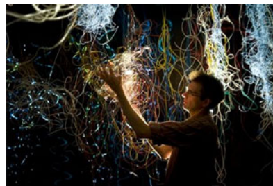
Daniel Canogar.

El artista inaugura hoy una exposición en el Museo de Arte Contemporáneo de La Coruña.